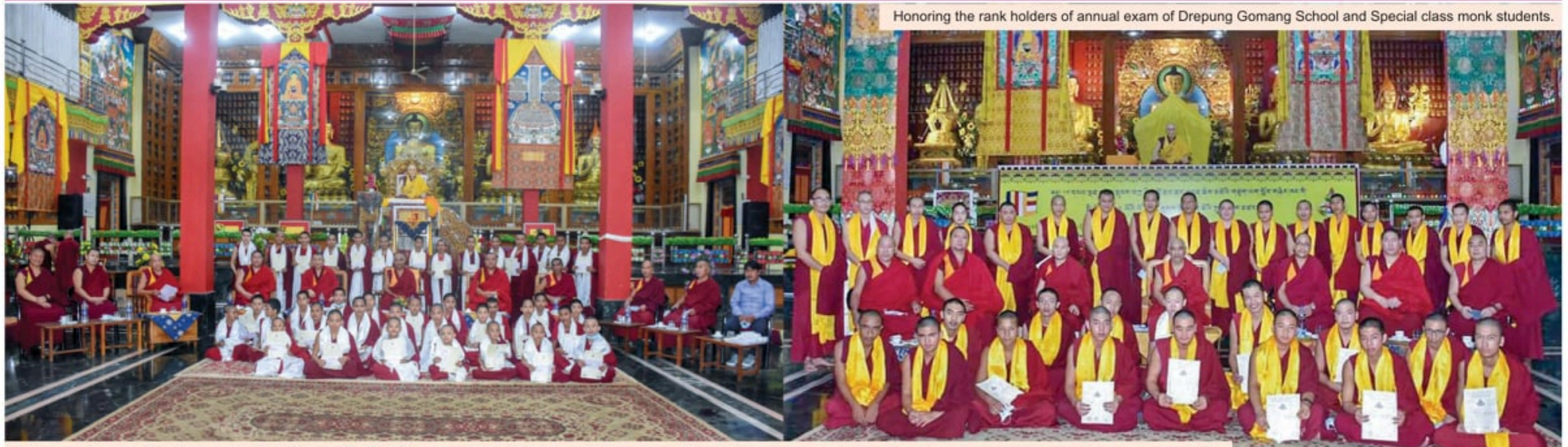
Honoring the rank holders of annual exam of Drepung Gomang School and Special class monk students.

PHONE.: 91-08301-245619 / 246084 / 245697 WEB SITE: www.drepunggomang.org www.drepunggomangusa.org www.drepunggomang.ru