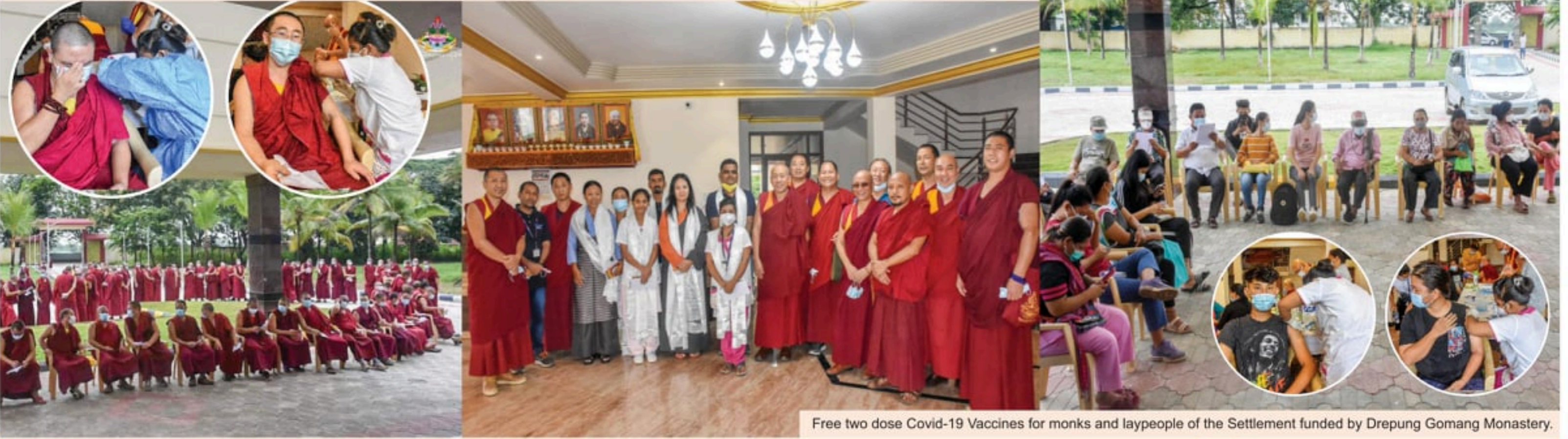
Free two dose Covid-19 Vaccines for monks and laypeople of the Settlement funded by Drepung Gomang Monastery.

ལྷ་ཚང་གི་གོ་སྐྱོད་ལོག་རང་ཁོངས་དགེ་འདུན་མང་དང་མོན་ལོ་གཉིས་མེ་བརྒྱ་ལྷག་འགའ་ཉོག་དབྱིབས་ནད་དུག་འགོག་ཁབ་སྤྲོད་སྤྱོད་གཉིས་རིན་མེད་ཚོས་སྤྱིན་གནང་བཞིན་པ།