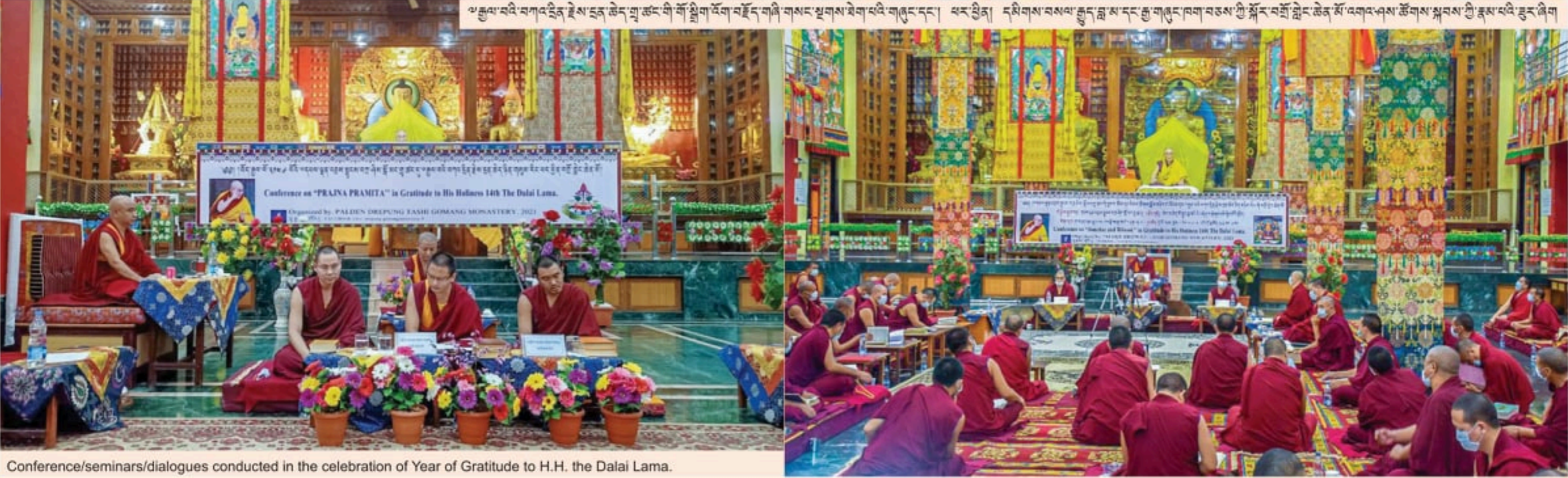
Conference/seminars/dialogues conducted in the celebration of Year of Gratitude to H.H. the Dalai Lama.

འཇུག་པའི་བཀའ་རྒྱུ་རྒྱུ་ཚེད་གྲྀ་ཚང་གི་ལོ་རྒྱུག་ལོག་བཞུང་གཞི་གསང་ལྷགས་ལེག་པའི་གཞུང་དང་། བར་ཕྱིན། དམིགས་བསལ་རྒྱུ་རྒྱུ་མ་དང་རྒྱ་གཞུང་ལག་བཅས་ཀྱི་སྐོར་བཞོ་སྐོར་ཚེད་མོ་འགའ་ཤམ་ཚོགས་སྐབས་ཀྱི་རྣམ་པའི་རྒྱུ་ལོག