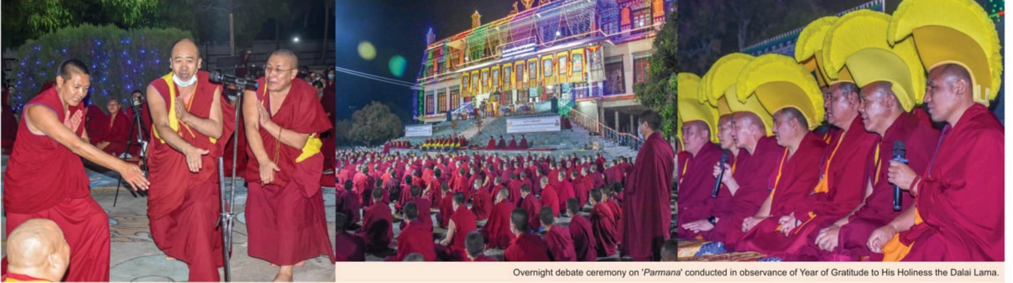
Overnight debate ceremony on 'Pamans' conducted in observance of Year of Gratitude to His Holiness the Dalai Lama.

ཕ་རྒྱལ་འཛིན་པ་གཞི་རྒྱུ་ཆེད་གྲུ་ཚང་གི་གོ་སྐྱོད་འོག་ནས་འབྲེལ་མཚན་སྤྲད་དམ་འཅའ་ཆེན་མོ་འཚོག་བཞིན་པ།