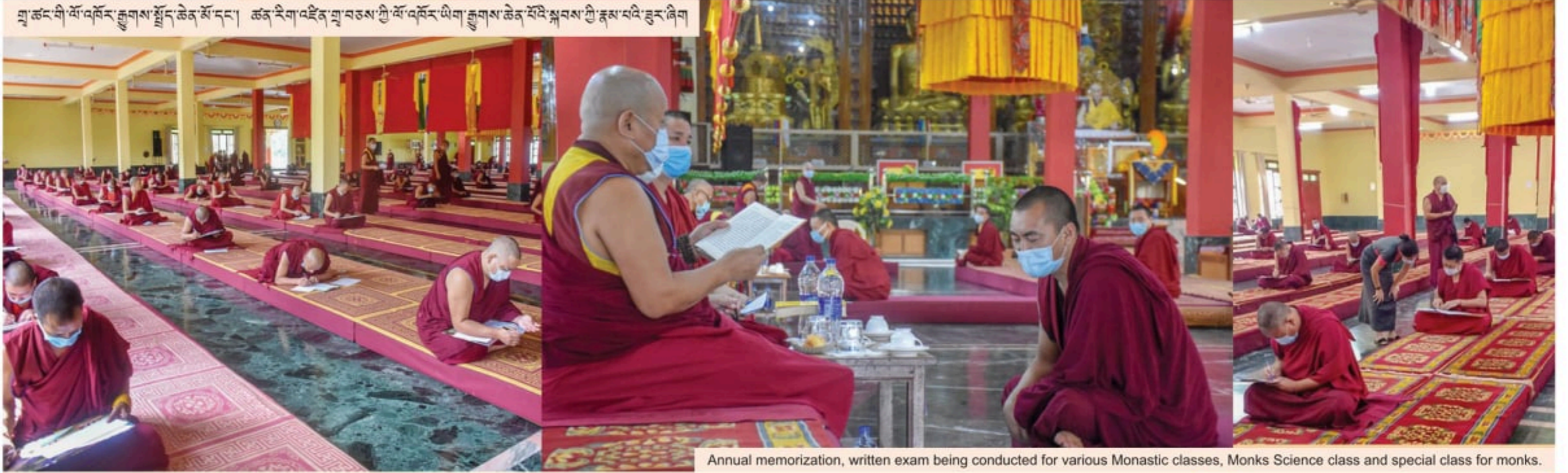
Annual memorization, written exam being conducted for various Monastic classes, Monks Science class and special class for monks.

བྱ་ཚང་གི་ལོ་འཁོར་རྒྱགས་སྤྱོད་ཚེན་མོ་དང་། ཚན་རིག་འཛིན་ལུ་བཅས་ཀྱི་ལོ་འཁོར་ཡིག་རྒྱགས་ཚེན་མོའི་སྐབས་ཀྱི་རྩམ་པའི་རྒྱུར་ཞིག་།