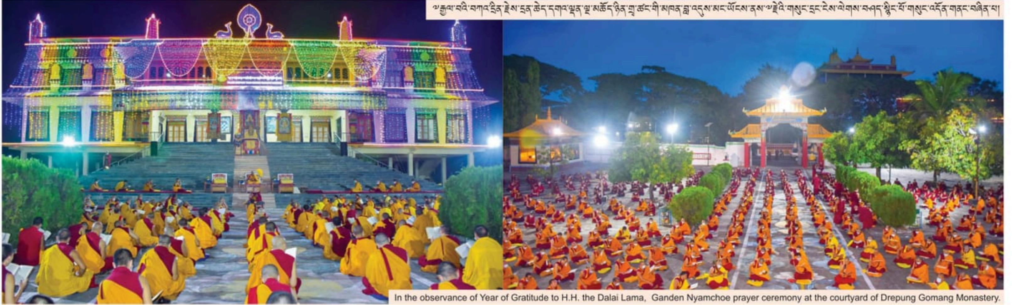
ལ་རྒྱལ་བའི་བཀའ་བློན་ཆེན་པོ་འཇམ་དཔལ་ལྷན་གྱི་མཚན་གྱི་སྐབས་ལྷན་འབྲས་མང་ལོངས་ནས་ཡུལ་གསུང་དང་རེས་ལེགས་བཤའ་སྤྲོད་པོ་གསུང་འདོན་གནང་བཞིན་པ།

PHONE.: 91-08301-245619 / 246084 / 245697 WEB SITE: www.drepunggomang.org www.drepunggomangusa.org www.drepunggomang.ru