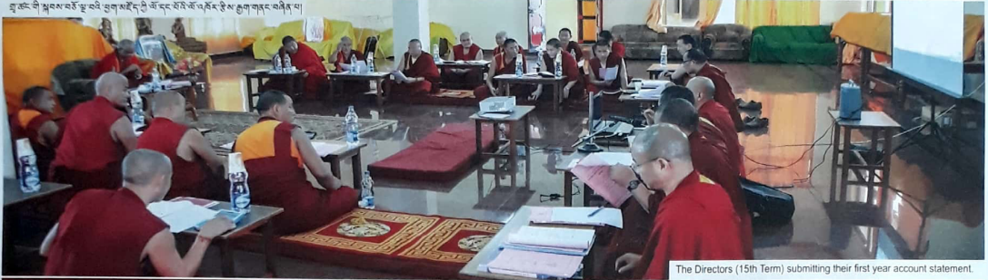
The Directors (15th Term) submitting their first year account statement.

གྲུ་ཚང་གི་སྐབས་བཅོ་ལྔ་པའི་འཇམ་མཛེན་གྱི་ལོ་དང་ལོ་དེ་ལོ་འཛིན་ཞེས་སྤྱི་གཞི་གནང་བཞིན་གཤིས།