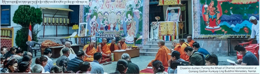
Choekhor duchen (Turning the Wheel of Dharma) commemoration at Gomang Gaden Kunkyop Ling Buddhist Monastery, Nantlai.

ནི་ཉེ་ཆར་འབྲས་སྤྱངས་མང་དགའ་ཚུན་ལུ་རྒྱ་ལྷོ་དང་ཕྱི་དབྱིན་པམ་ཚོས་འཛིན་ཏུ་ས་ཚེན་སྤང་བའི་གནང་བ།