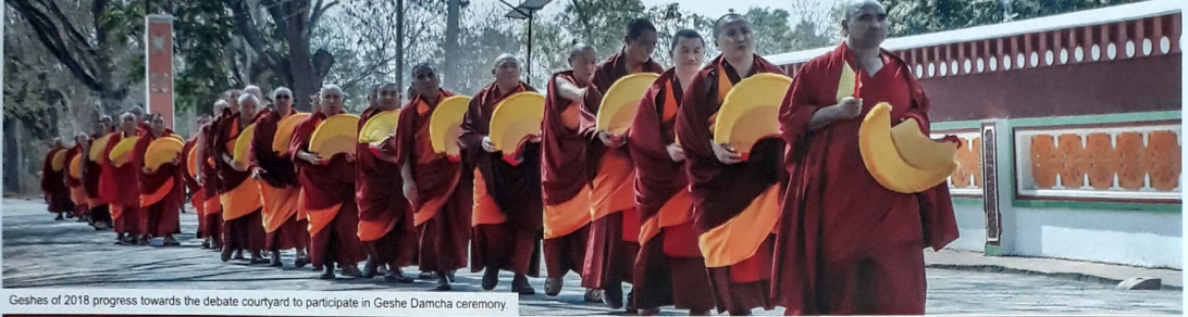
Geshes of 2018 progress towards the debate courtyard to participate in Geshe Damcha ceremony.

བོད་རྒྱལ་ལོ་ ༣༡༤༦ རབ་བྱུང་ ༡༧ ས་མོ་ཕག་གི་ལོ། ཟ๳་ལོ་ ༣༠༡༧ ལོ། 2019