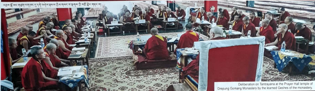
Deliberation on Tantrayana at the Prayer Hall temple of Drepung Gomang Monastery by the learned Geshes of the monastery.

འབྲས་སྒོ་མང་གྲ་ཚང་གི་ཆོས་སྒྲུབ་ལུང་དུ་དབུ་བཞེས་པའི་མཉམ་སྲུང་གི་སྤྱི་ཤེས་འཚོམས་ཀྱི་བཞུགས་ཀྱི་གནས་ཁོངས་ལྟེང་གི་རྒྱུ་