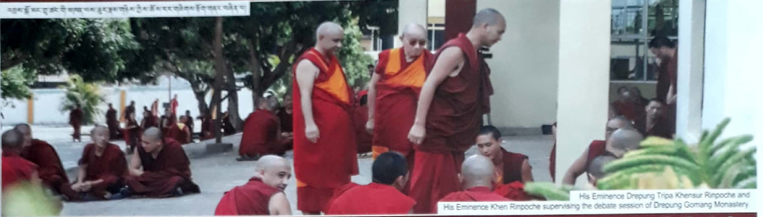
His Eminence Khen Rinpoche supervising the debate session of Drepung Gomang Monastery

འབྲས་སྤྲངས་ཚུ་མང་གྲ་ཚང་གི་ཆེས་མཁན་པོ་མཆོག་གི་མ་འཇམ་མེད་པའི་ཐོས་སྒྲིག་གནས་པའི་མཉམ་སྲུབ་ལོ་རྒྱུས་ལྟར་ལོ་རྒྱུས་ལྟར་།