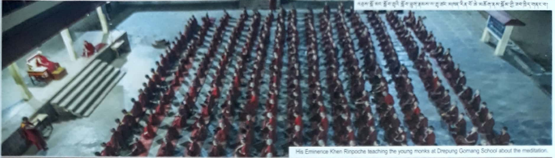
His Eminence Khen Rinpoche teaching the young monks at Drepung Gomang School about the meditation.

PHONE: 91-08301-245619 / 246084 TELEFAX: 91-08301-245697 WEB SITE :www.drepunggomang.org www.drepunggomangusa.org www.drepunggomang.ru