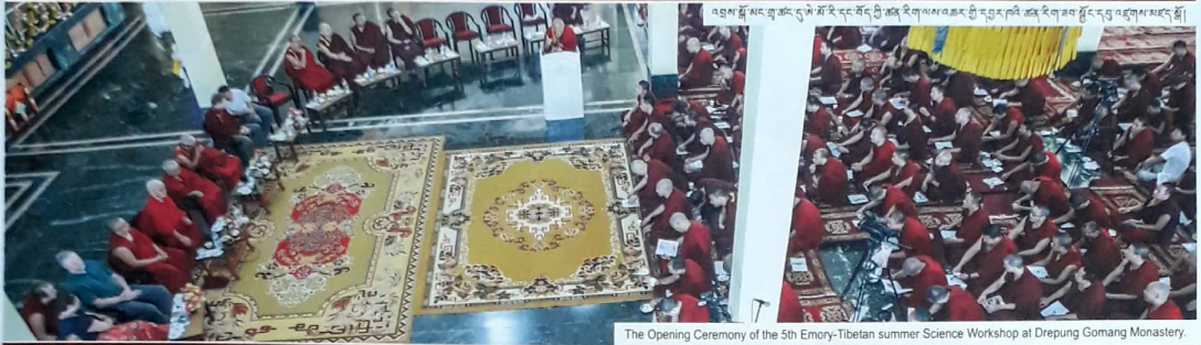
The Opening Ceremony of the 5th Emory-Tibetan summer Science Workshop at Drepung Gomang Monastery.

P.O. TIBETAN COLONY-581411 DISTT: UK, KARNATAKA STATE, SOUTH INDIA. PHONE : 91-08301-245619 / 246084 TELEFAX: 91- 08301-245697 WEB SITE: www.drepunggomang.org www.drepunggomangusa.org www.drepunggomangur.