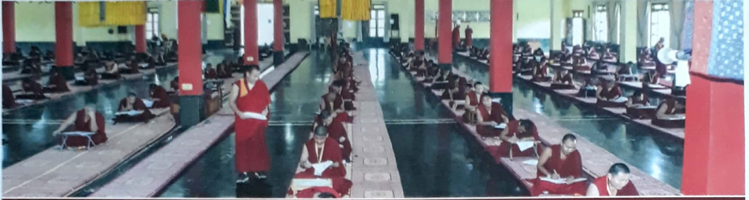
Monks giving their written test as part of Annual Examination of Drepung Gomang Monastery.

བོད་རྒྱལ་ལོ་ ༡༡༥༦ རབ་བྱུང་ ༡༧ ས་མོ་ཕག་གི་ལོ། ཟ࿳་ལོ་ ༡༠༡༧ ལོ། 2019