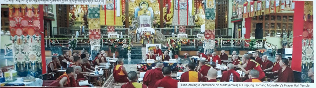
Uma-droling (Conference on Madhyamika) at Drepung Gomang Monastery's Prayer Hall Temple.

འབྲས་སྤྱངས་སྤོ་མང་གྲ་ཚང་གཞི་གཞུང་གི་དབུ་མའི་སྒོ་ནང་གི་ལོ་ཐོ་སྤྱི་བཟོ་སྒྲིབ་གནང་བཞིན་ལ།