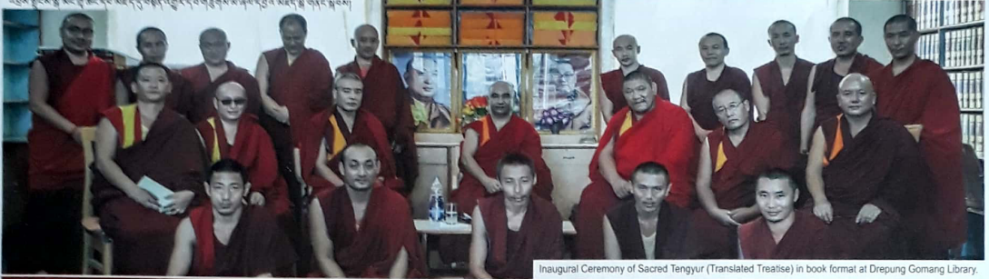
Inaugural Ceremony of Sacred Tengyur (Translated Treatise) in book format at Drepung Gomang Library.

འབྲས་སྤྲེངས་སྤོ་མང་གུ་ཚང་གི་ལོ་རྒྱུ་དུ་བཞུགས་པའི་འགྲུབ་ལུ་ལྷན་གྱི་ལྷན་པོ་གི་མངའ་སྡེ་དུ་གནང་བའོ།